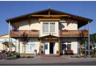
Rezeptionsgebäude obere Etage „SEEBLICK-OASE“