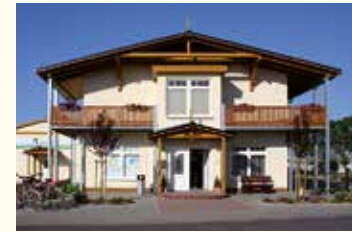
Rezeptionsgebäude obere Etage „SEEBLICK-OASE“